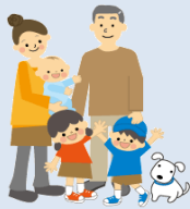
家族で楽しい思い出づくり。