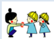
各園の先生から、園児・保護者へプレゼント。