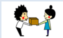
各園に手渡しで納品。